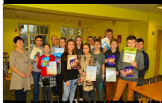
2. Klases bērni, kas piedalījās konkursā "Mēs un mūsu vide".