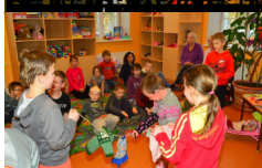
3. Klases bērni, kas piedalījās konkursā "Mēs un mūsu vide".