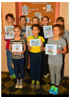
1. Klases bērni, kas piedalījās konkursā "Mēs un mūsu vide".