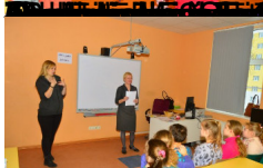
4. Klases bērni, kas piedalījās konkursā "Mēs un mūsu vide".