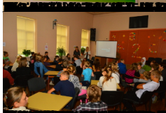
2015. gada 11. septembrī, 11.00-12.00, Ķemulienes pamatskola, Daugavpils, Ķemulienes