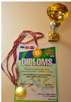
2015. gada 11. septembrī, 10.00-11.00, Ķemulienes pamatskola, Daugavpils, Sīmpajs