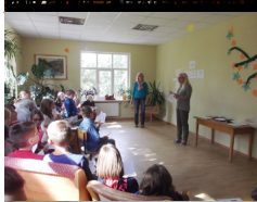
2015. gada 11. septembrī, 12.00-13.00, Ķemulienes pamatskola, Daugavpils, Ķemulienes