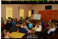
2015. gada 11. septembrī, 13.00-14.00, telpā "Sveiciens skolēniem" notika pasākums "Sveiciens skolēniem"