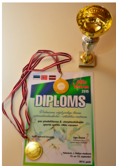
2015. gada 11. septembrī, 10.00-12.00, telpā "Sveiciens skolēniem" notika pasākums "Sveiciens skolēniem"