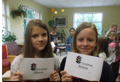
2015. gada 11. septembrī, 14.00-15.00, telpā "Sveiciens skolēniem" notika pasākums "Sveiciens skolēniem"