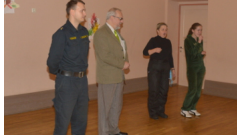
46. līmeņa iecirkņu skolotāju grupas aizsardzības prasmes kopā ar Valmieras iecirkņa Kārtības